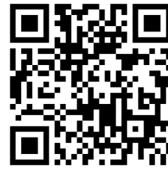
Ласкаво просимо до IL