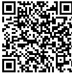
Список World Relief